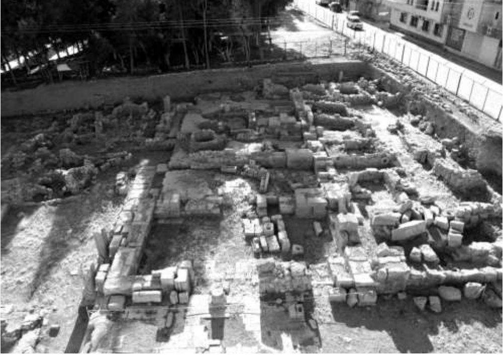
Fotoğraf 1: Nusaybin Akademisi'nin kazılarla ortaya çıkartılan bir bölümü

Kaynak: Elif Keser Kayaalp ve Nihat Erdoğan, “The Cathedral Complex at Nsibis”, Anatolian Studies 63 (Dec 2013): s. 137-154.