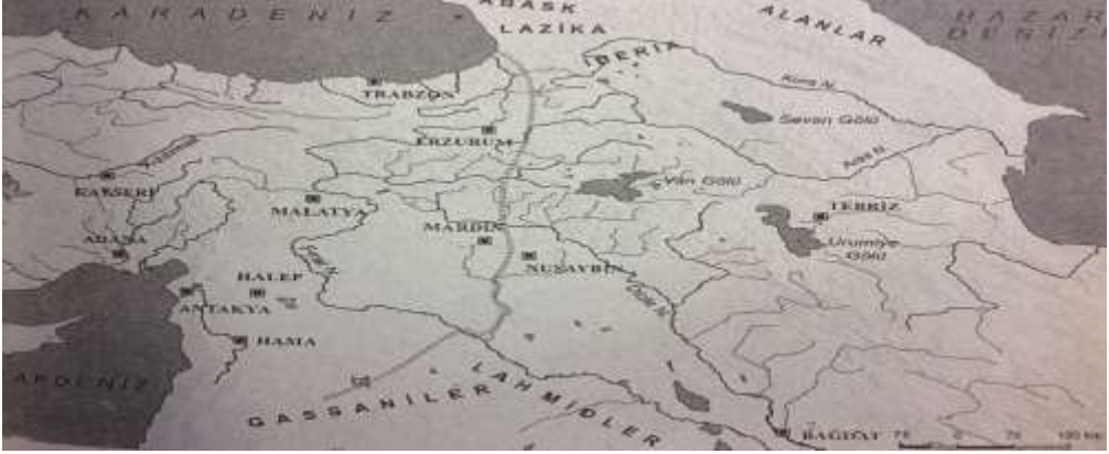
Harita 2: 365 yılı Roma-Pers sınır.