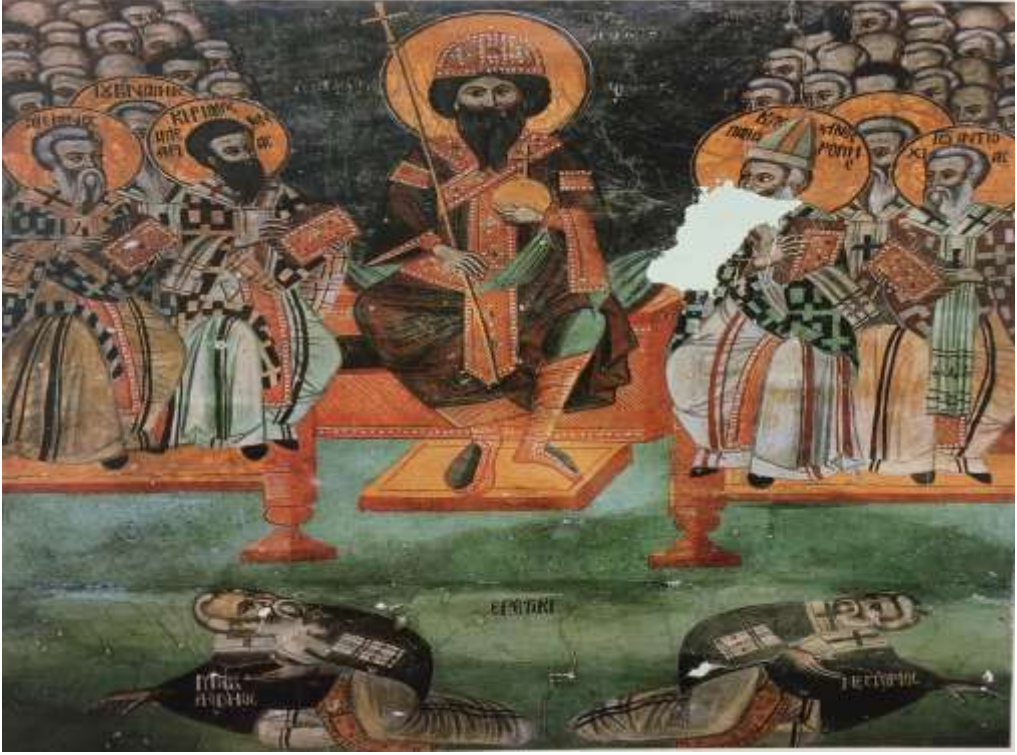
Fotoğraf 3: İmparator Theodisius'un Mor Nastur'u Efes Konsili'nde sapıklıkla suçlamasını resmeden bir figür.